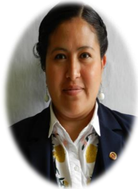
Coordinación 1° Secundaria