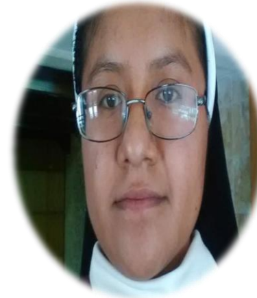
Sub Dirección Secundaria