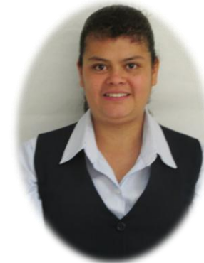
Coordinación 3° Secundaria