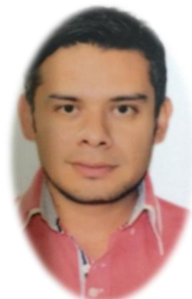
Desarrollo Humano, Taller Creación Gráfica Profa. Francisco Soto