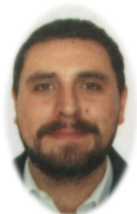
Formación Cívica y Ética Profa. Rubén Félix