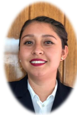
Coordinación 2° Secundaria